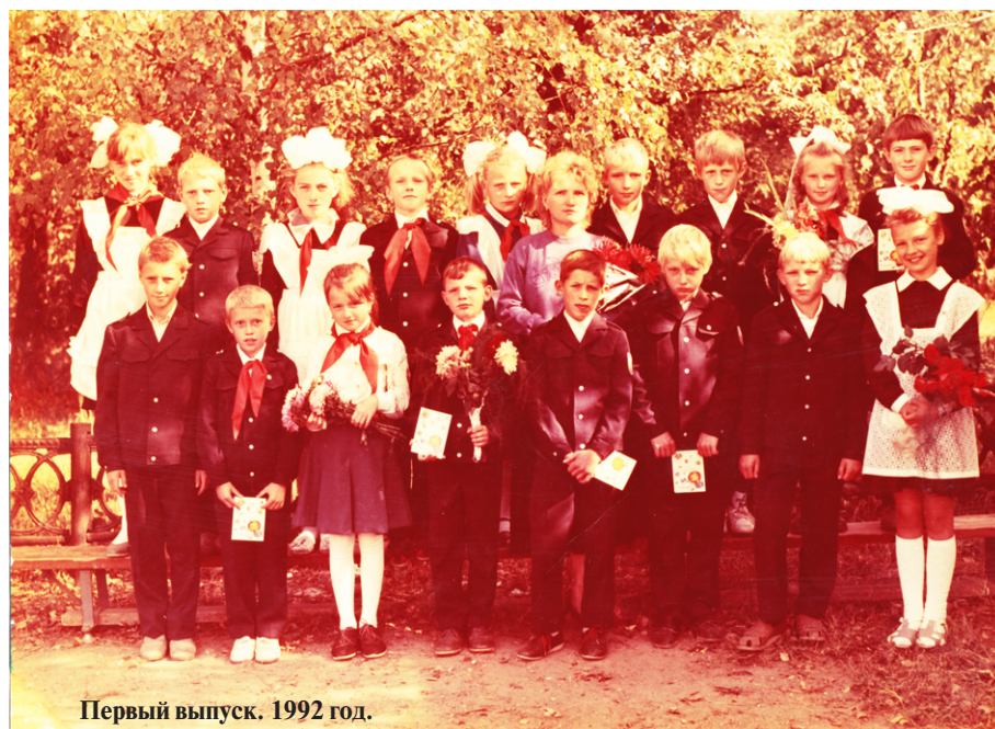
Первый выпуск. 1992 год.

В общеобразовательных учреждениях Перемышльского района трудятся 164 педагогических работника. 139 педагогов (84,6%) прошли аттестацию. 60 человек (43,4%) имеют первую и высшую квалификационную категорию. Молодых специалистов (до 30 лет) — 22 человека. 33 педагога имеют звания: «Заслуженный учитель Российской Федерации» (1), «Почетный работник общего образования Российской Федерации» (3), «Заслуженный работник образования Калужской области» (3), «Отличник народного просвещения» 26 человек.