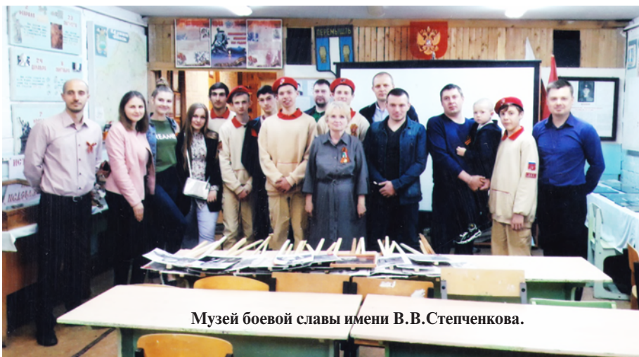
Музей боевой славы имени В.В.Степченкова.