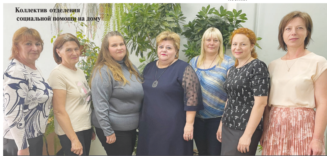
Коллектив отделения социальной помощи на дому

- Например, работая в правовом отделе администрации района, я познакомилась с замечательными людьми — главами администраций сельских поселений, с депутатами Сельских Дум, руководителями предприятий, организаций и многими другими, с которыми и сейчас нахо-