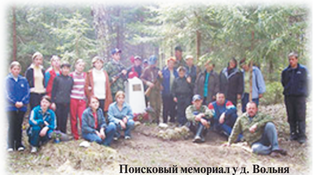
Поисковый мемориал у д. Вольня