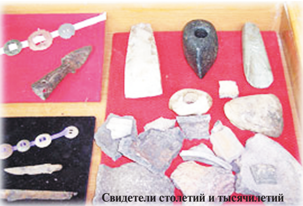
Свидетели столетий и тысячелетий

* Дела давно минувших дней (вятичи – монголо-татарское нашествие – «Стояние на Угре»)