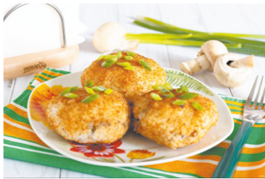
рис круглозерный 300 г; вода (для варки риса) 800 мл; грибы отварные 250 г; лук репчатый 1 шт.; чеснок (зубчики) 2 шт.; крахмал кукурузный 1 ст.л.;

мука 1 ст.л.; сухари панировочные 50 г; перец черный молотый по вкусу; соль по вкусу; масло растительное.