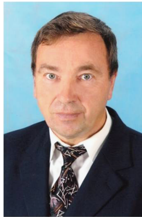
Отдел образования, молодежной политики и охраны прав детства.

Мы желаем Вам того, о чем мечтают все люди на Земле — сохранить крепкое здоровье на долгие годы, желаем Вам ещё много-много лет жить в гармонии с собой, получая от жизни удовольствие. Неисчерпаемой энергии, бодрости, воодушевления и большой удачи!