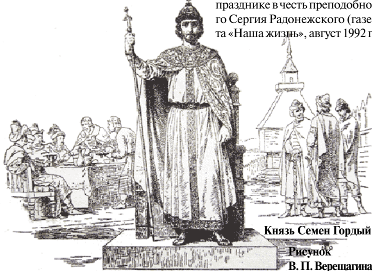
Князь Семен Гордый Рисунок В. П. Верещагина

Из материала, подготовленного Гутенко Л.В., о прошедшем в июле празднике в честь преподобного Сергия Радонежского (газета «Наша жизнь», август 1992 г)