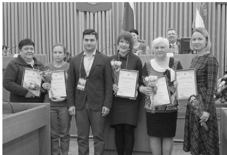
Информация предоставлена из Центральной районной библиотеки.

На этом работа форума не закончилась, его участников ещё ждала большая культурная программа.