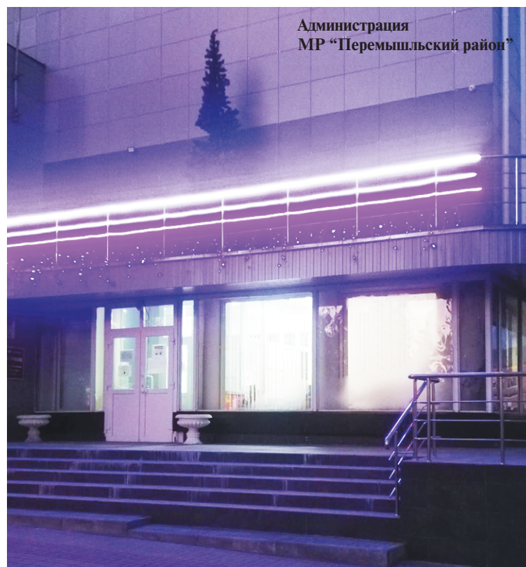
Администрация МР «Перемышльский район»

Таковыми природными украшениями можно декорировать двери, новогодний стол 2021, расставить в виде букетов, помещенных в керамические или прозрачные стеклянные вазы в разных частях комнаты.