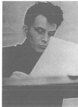
1965 год. Начало журналистской биографии.