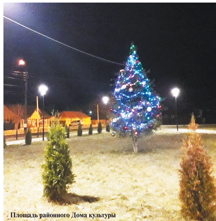
Площадь районного Дома культуры