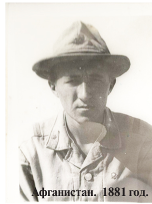
Афганистан. 1981 год.