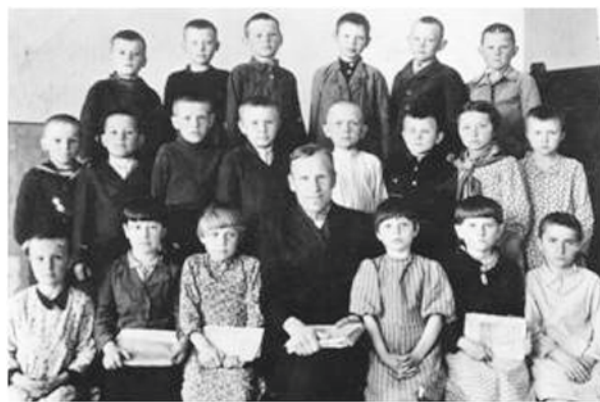
Детские годы. 1946 год

Вот немцев я совершенно не помню, а наших солдат, как сейчас вижу. Как они на улице еду варили, как в нашей спальне командир спал, как солдаты на пол соломы настелили и спали там, как ружья вдоль стены выстроены были, которые я всё время трогала. Они мне подарили зелёную противогазную коробку для кукол».