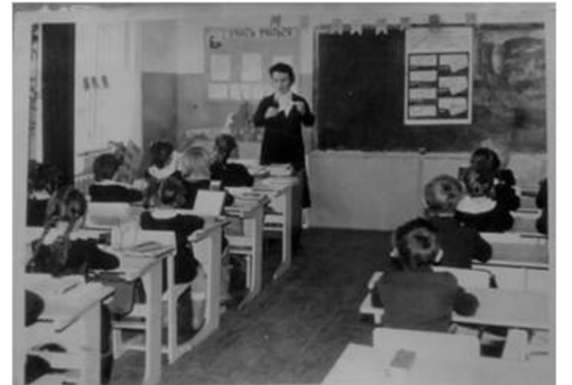
Урок в новой школе.

лось вместе с ней готовить все праздники. Выступали в старом доме культуры. Когда район перевели в Калугу, нам отдали 2-ой этаж Райисполкома, и наступил рай. Кроме классных комнат у нас была комната для настольных игр (домино, шашки, шахматы и другие игры); комната — библиотека (книги несли из дома, записывали их в общий список, выдавали домой, записывая в формуляры). Здесь же мы слушали музыку разных композиторов, была комната для просмотра кинофильмов. Дети готовили билеты «в кино», разрисовывали, пропускали в зал используя вежливые слова (здравствуйте, пожалуйста, спасибо и т.д.), усаживали на свои места.