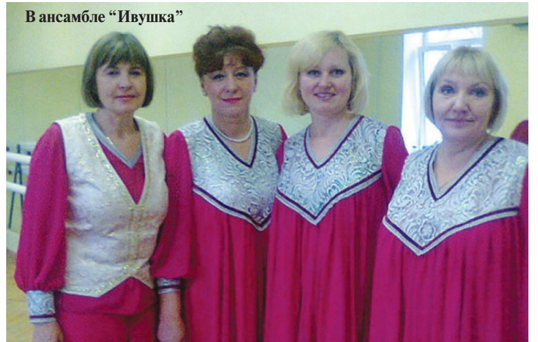
В ансамбле «Ивушка»