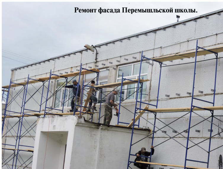
Ремонт фасада Перемышльской школы.

В самой же Хотисинской школе завершён ремонт спортивного зала по программе министерства образования Калужской области.