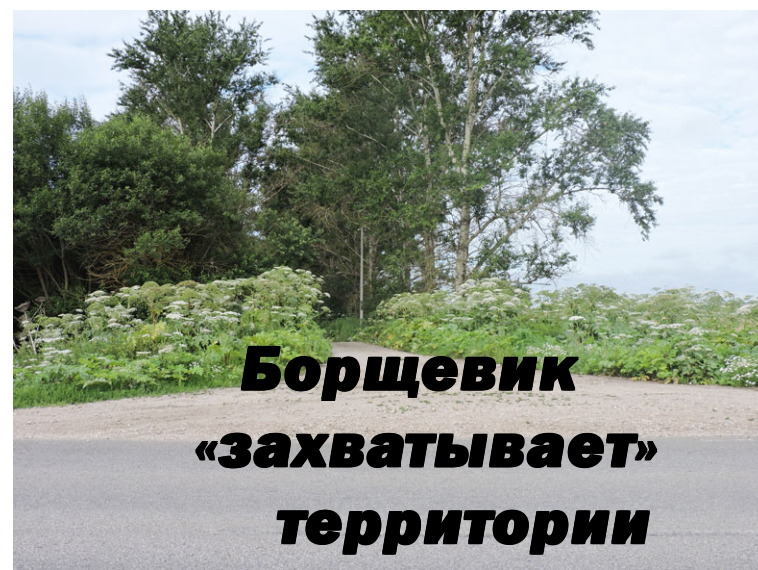
Борщевик «захватывает» территории

Все лето ведут борьбу с борщевиком жители многоквартирного дома № 58 по ул. Республиканской, не давая сорнякам «поднять голову».