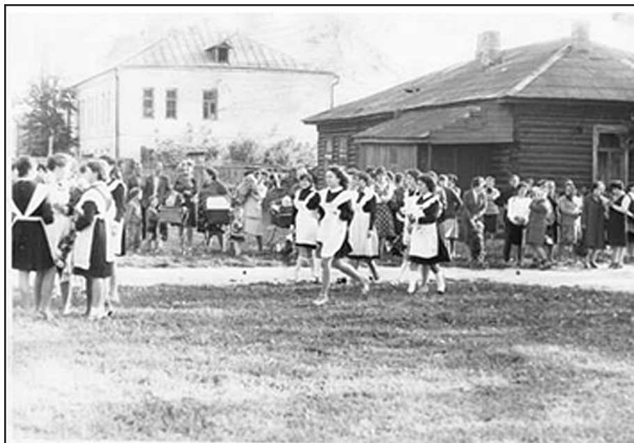
Школа, старое здание в тихом, уютном Перемышле. Она меняла своё местоположение, но не меняла свой дух – дух патриотизма, стремления к справедливости желания сделать мир лучше, светлее и красивее...

дения и смерти – 1915-1980. Поиск сведений и фотографии о нём продолжается.