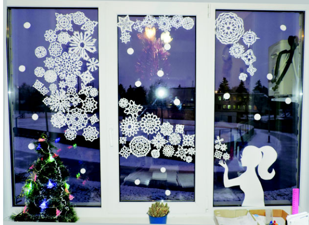
Отдел социальной защиты населения, как всегда на высоте. Посмотрите на это окно, это же произведение искусства.