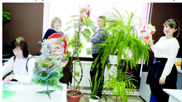
В МФЦ в предновогодние дни и работы много, и настроение праздничное.