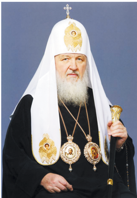
Преосвященные архипастыри, досточтимые отцы, всечестные иноки и инокини, дорогие братья и сестры! ХРИСТОС ВОСКРЕСЕ!

Милостью Всещедрого Бога мы сподобились достигнуть светозарной пасхальной ночи и вновь радуемся славному Христову Воскресению. Сердечно поздравляю всех вас, мои дорогие, с этим великим праздником и торжеством из торжеств. Почти две тысячи лет отделяют нас от воспоминаемого ныне события. Однако каждый год Церковь с неизменным духовным трепетом празднует Воскресение Господне, неустанно свидетельствуя