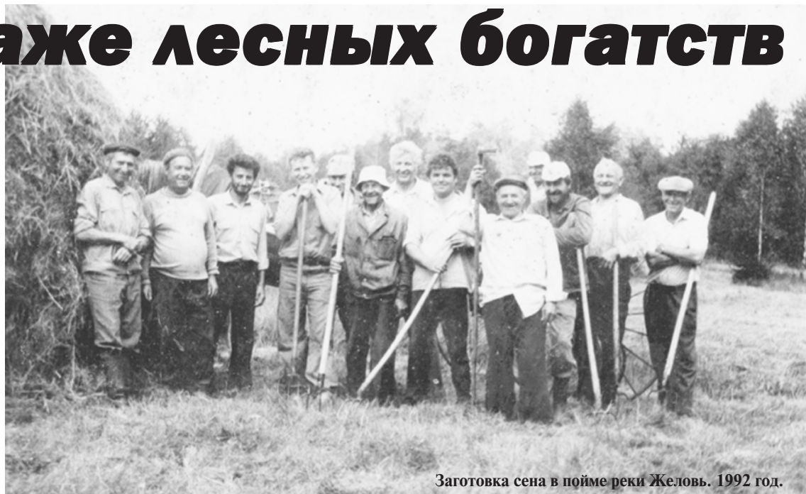
Заготовка сена в пойме реки Желовь. 1992 год.