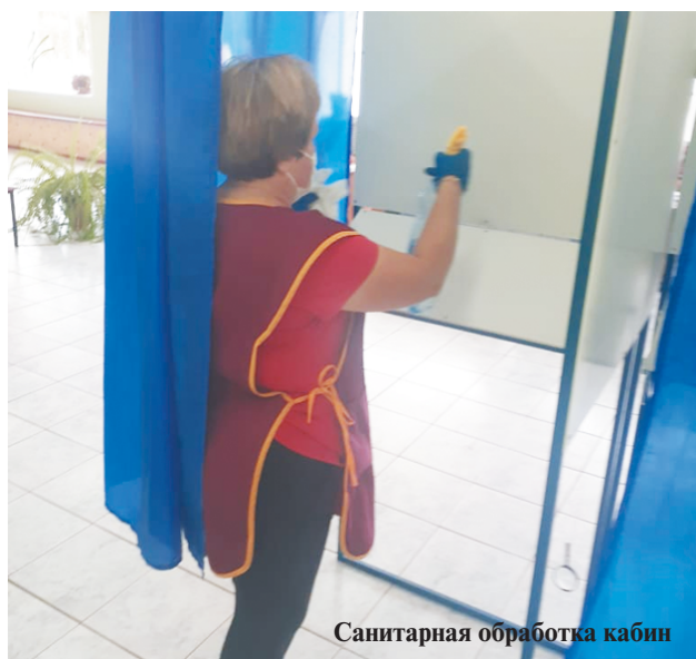
Санитарная обработка кабин