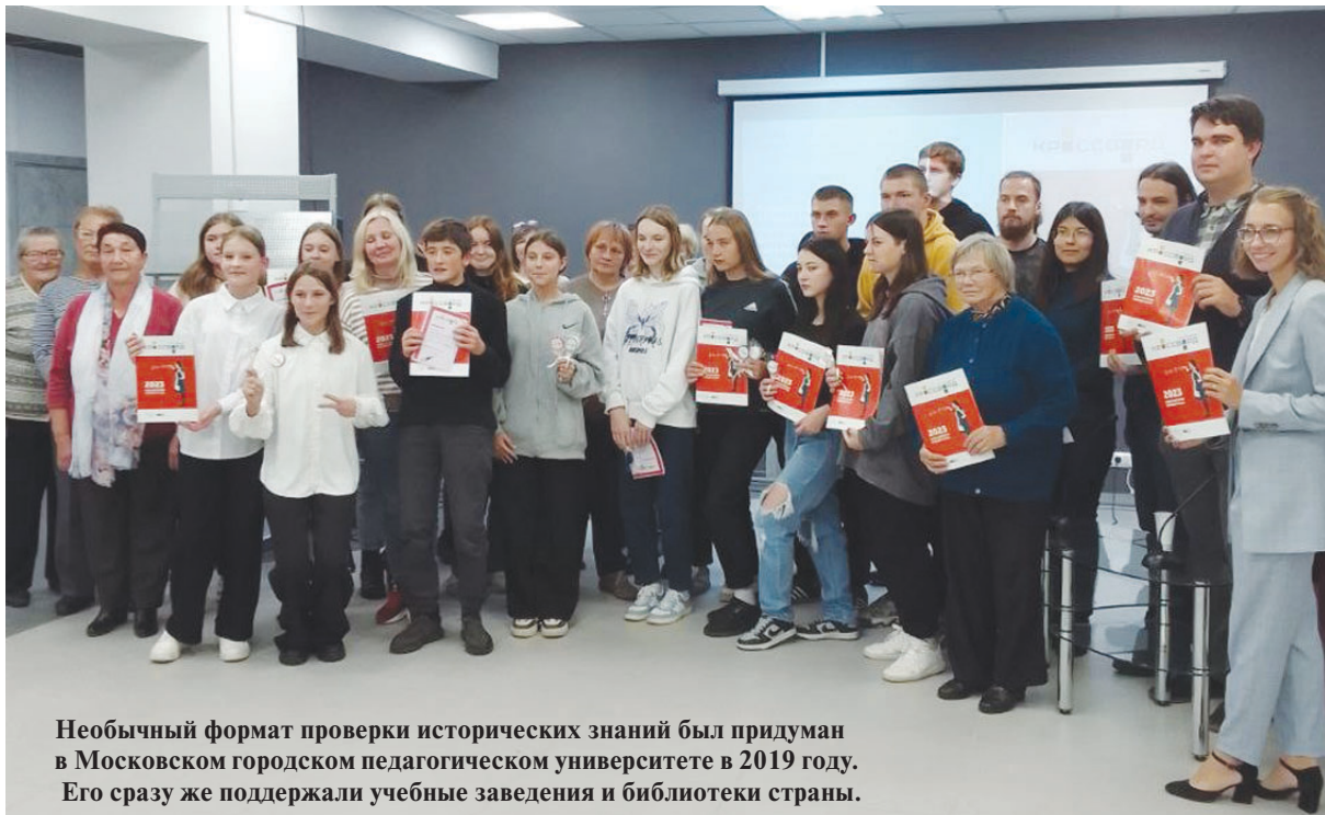
Необычный формат проверки исторических знаний был придуман в Московском городском педагогическом университете в 2019 году. Его сразу же поддержали учебные заведения и библиотеки страны.

За 45 минут участники выполнили 12 заданий, за каждое из которых давалось определённое количество баллов. В конце баллы суммировались и каждому участнику по количеству набранных баллов был присвоен чин, вручен сертификат участника и сладкий подарок.