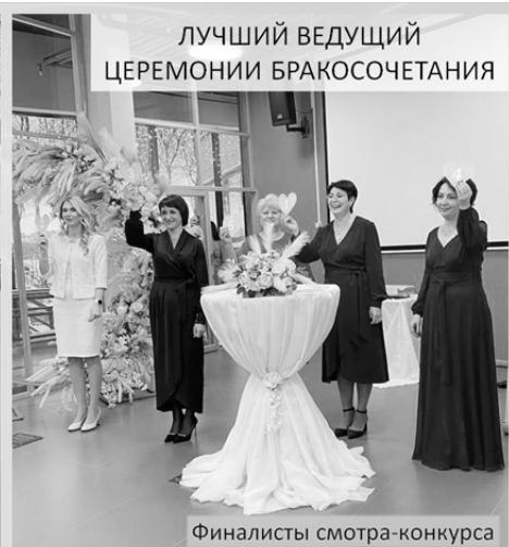
ЛУЧШИЙ ВЕДУЩИЙ ЦЕРЕМОНИИ БРАКОСОЧЕТАНИЯ