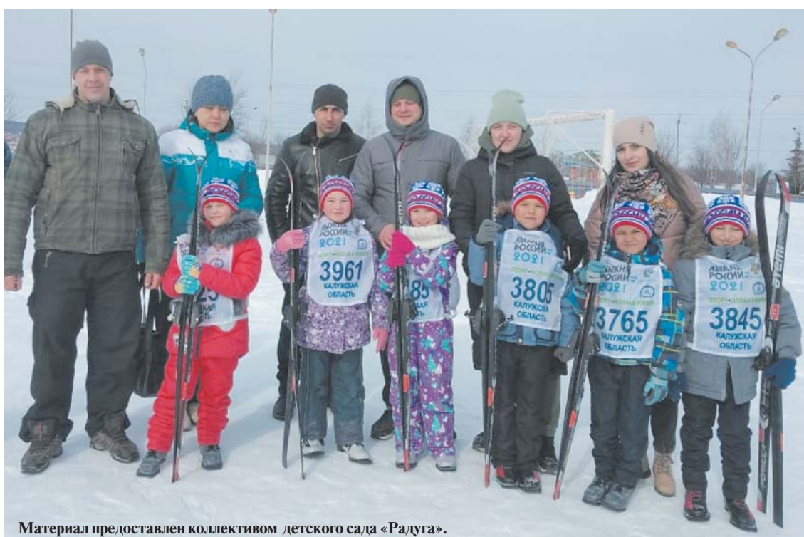
Материал предоставлен коллективом детского сада «Радуга».