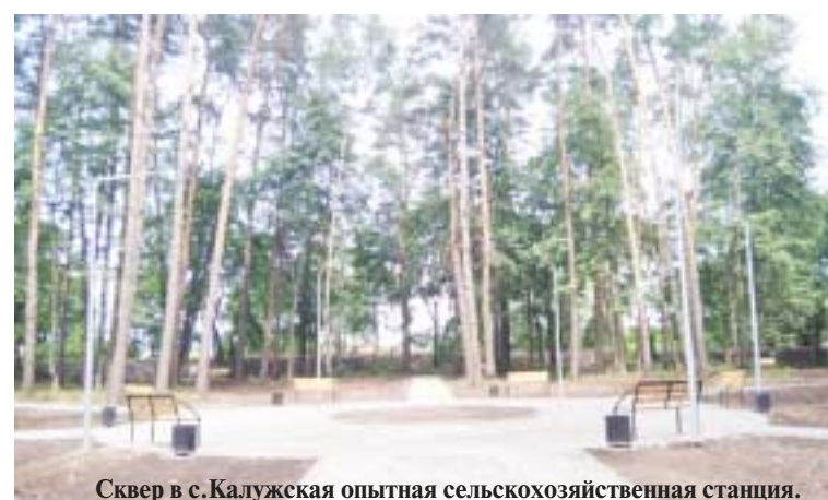
Сквер в с.Калужская опытная сельскохозяйственная станция.