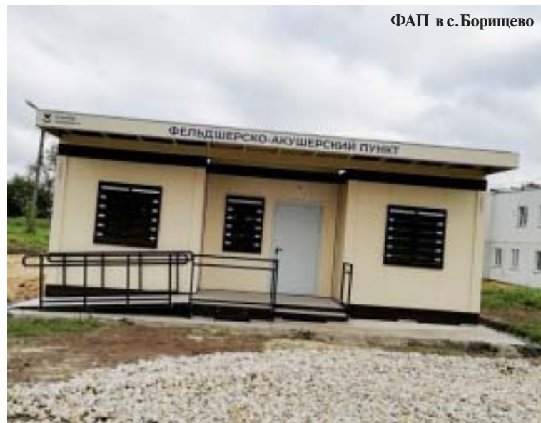
ФАП в с.Борищево