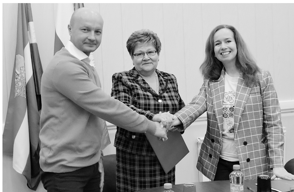
Район: дела, проблемы

Планируется, что этот конкурс станет ежегодным.