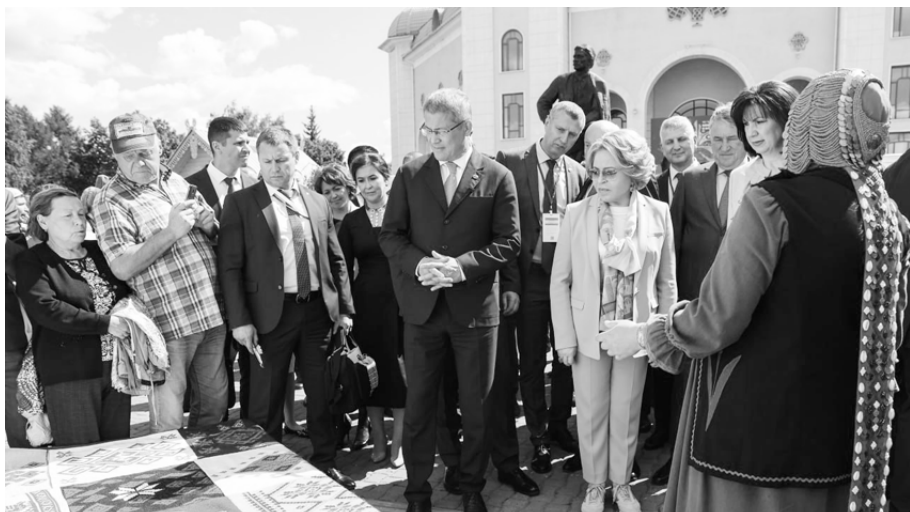
Валентина Матвиенко, Наталья Кочанова и Глава Республики Башкортостан Радий Хабиров открыли выставку достижений народного хозяйства России и Беларуси.