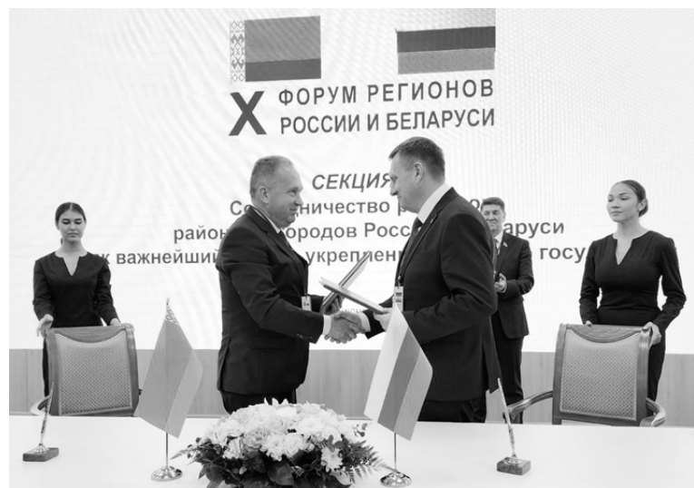
Подписание плана мероприятий по реализации ранее заключенного соглашения о сотрудничестве с Брестским областным Советом депутатов