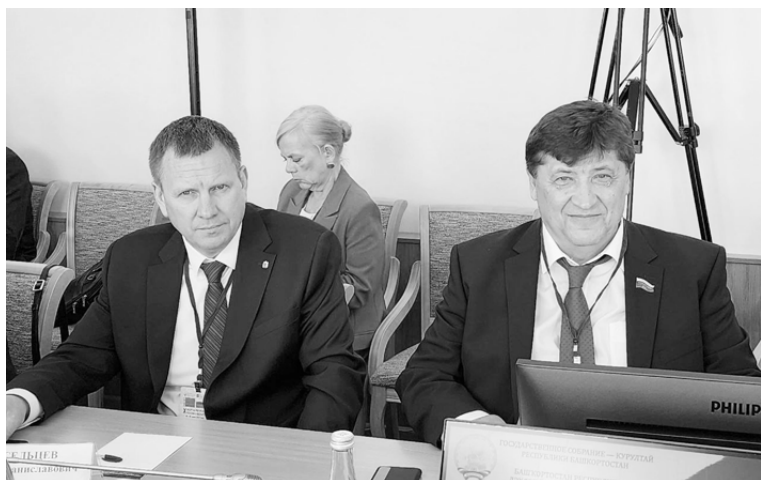
Юрий Клепиков от лица белгородцев поблагодарил калужан за гуманитарную помощь