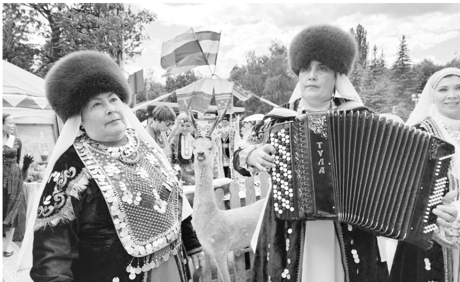
На улице Дружбы прошел фестиваль этнических культур