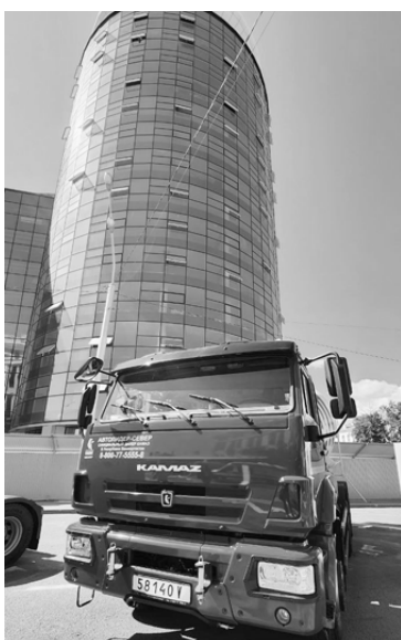
На выставке была представлена техника российских и белорусских производителей

Одним из ярких и впечатляющих мероприятий Форума стала выставка достижений народного хозяйства, которая разместилась на улице Дружбы. 35 компаний из 19 регионов России и Беларуси представили здесь стенды со своей продукцией. Отдельного внимания заслуживает экспозиция крупногабаритной сельскохозяйственной, дорожной, коммунальной и снегоуборочной техники производства таких предприятий как КАМАЗ, МАЗ, Уралмаш, Ростсельмаш, Минский Тракторный Завод, Амкордор.