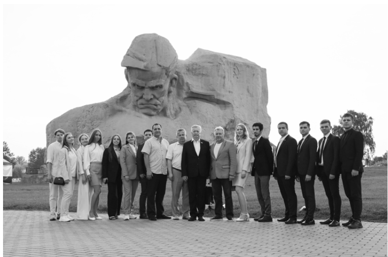
22 июня молодежный парламент Калужской области побывал в Бресте

Подготовлено по материалам пресс-службы Законодательного Собрания Калужской области.