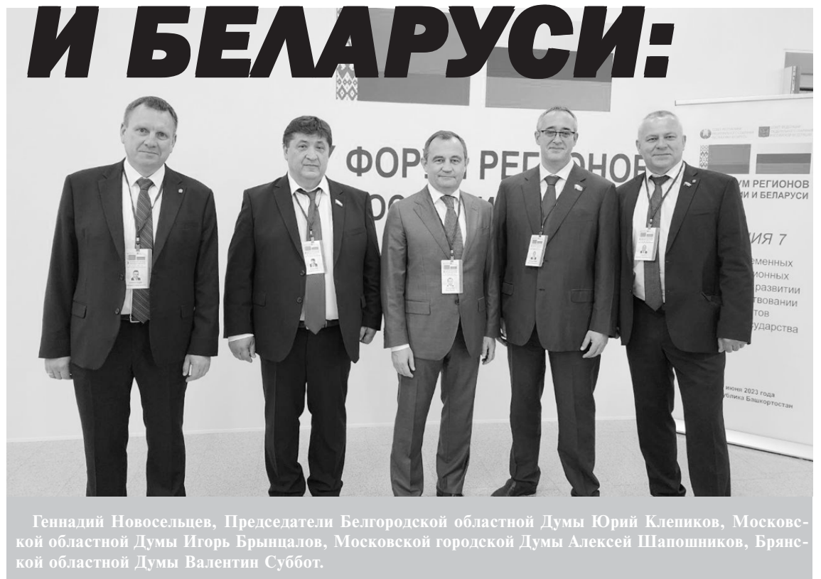
Геннадий Новосельцев, Председатели Белгородской областной Думы Юрий Клепиков, Московской областной Думы Игорь Брынцалов, Московской городской Думы Алексей Шапошников, Брянской областной Думы Валентин Суббот.

ТОП-5 совместно реализованных проектов: * «Меркатор» - «МАЗ»; * «ВМК Инвест» - «МАЗ»; * «КЗАЭ» - «БелАЗ»; * «КАДВИ» - «БелАЗ»; * «СТМ» - Белорусская железная дорога.