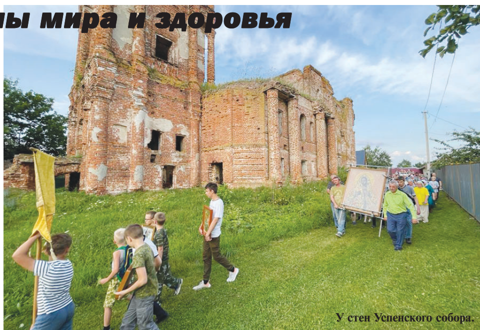
У стен Успенского собора.

Чудотворная Калужская икона Божией Матери стала неоскудеваемым источником чудес. О них необходимо возвещать миру,