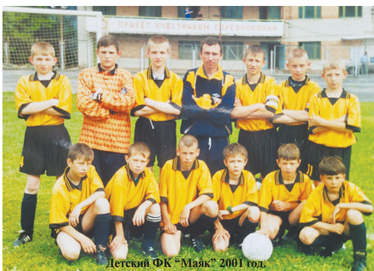
Детский ФК «Маяк» 2001 год.