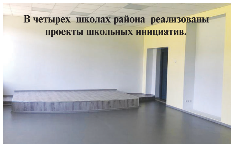
В четырех школах района реализованы проекты школьных инициатив.

Это проекты, в рамках которых ученики предлагают идеи по усовершенствованию пространств в своих образовательных учреждениях: будь то классы, прилегающие к школе территории или что-то иное.