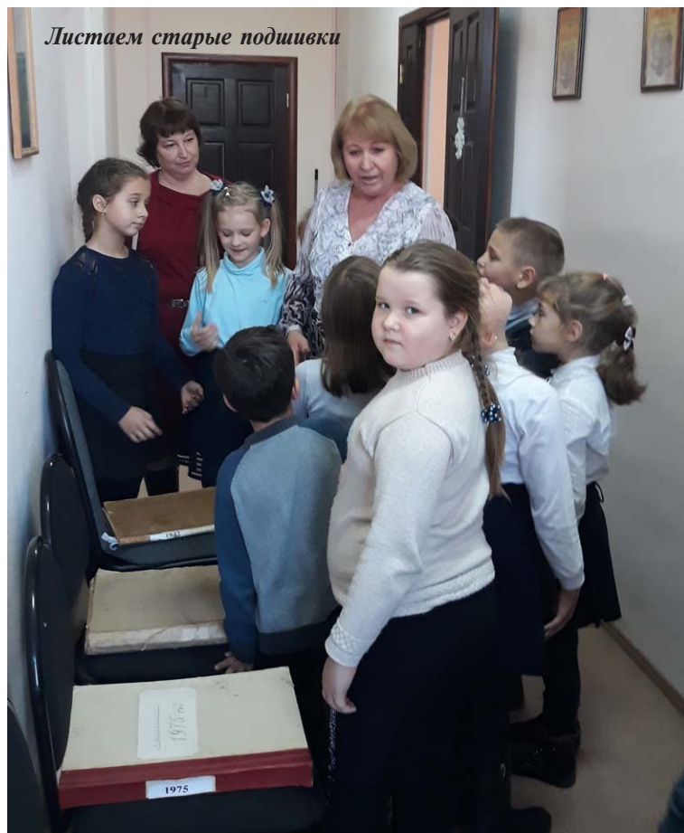
Листаем старые подшивки