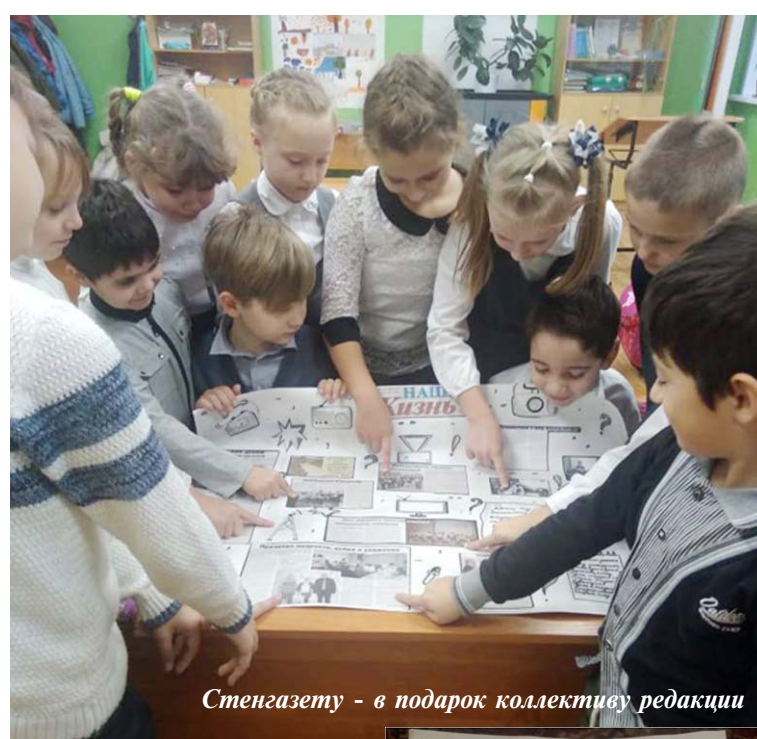
Стенгазету — в подарок коллективу редакции