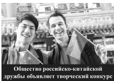
Общество российско-китайской дружбы объявляет творческий конкурс

дого из нас обязательно обернется большой радостью для маленького человека, попавшего в беду.