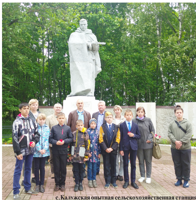
с.Калужская опытная сельскохозяйственная станция