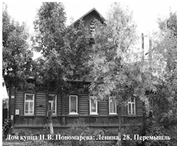
Дом купца Н.В. Пономарева: Ленина, 28, Перемышль

В альбоме Перемышльской школы история образовательного учреждения начинается словами: «Жители Перемышля утверждают, что если провести на карте европейской части страны прямые линии от самой северной точки до самой южной, и от западной до восточной, то линии пересекаются где-то близ их села. Село действительно расположено в самом центре европейской России. Холмистые поля и березовые рощи, широкая лента реки Оки. Памятники войны. Здесь, на подступах к Москве, шли ожесточённые бои. На каменных плитах братской могилы десятки имён. В селе три с половиной тысячи жителей, несколько улиц, из конца в конец километра полтора. Двухэтажное каменное здание архитектуры прошлого века и ещё пять домов поблизости и есть первая школа Перемышля».