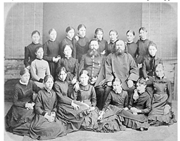
Преподаватели с учениками в начале 20-го века.