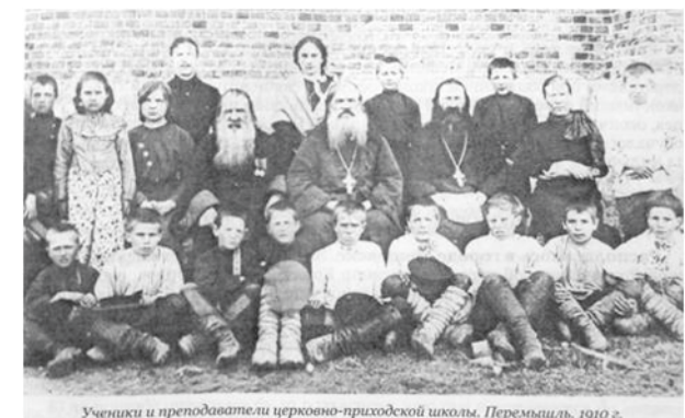
Ученики и преподаватели церковно-приходской школы. Перемышль. 1910 г.