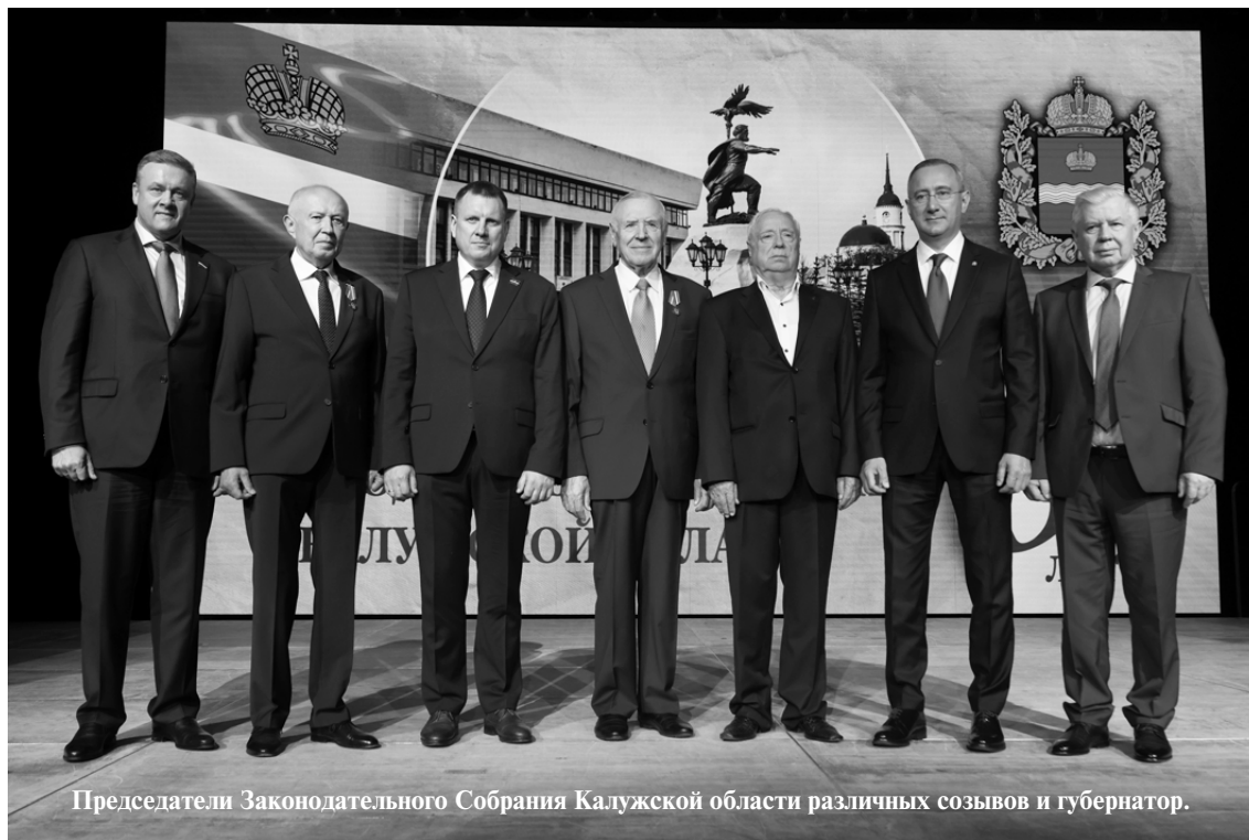
Председатели Законодательного Собрания Калужской области различных созывов и губернатор.

ворил глава государства. Желаю депутатам и всем присутствующим успехов и слаженной эффективной работы на благо нашей за-