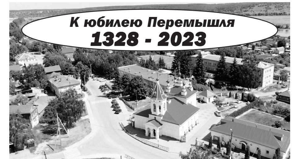
К юбилею Перемышля 1328 - 2023

Церквей 5: 1) Успенский собор. он находится в Завершье, которое отделено от города вром естественного происхождения. В актах XVII в. Завершье называется «старым острогом», «старым городищем». Храм двухэтажный; главная церковь четырехугольная с тремя алтарными абсидами; кровля шатром на четыре ската с одной главой. Трапезная с северной и южной стороны украшена портиками на четырех колоннах. Колокольня трехъярусная с колоколами на каждом ярусе. Основание собора относят к далекой старине; одни доходят до времен Юрия Дол-