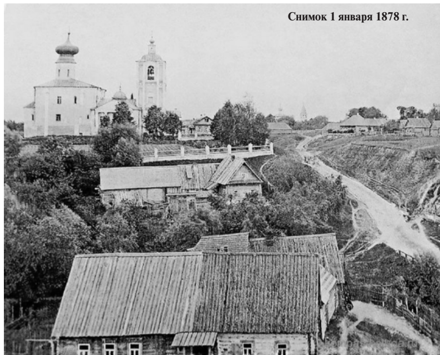
Снимок 1 января 1878 г.

Средних учебных заведений в Перемышле нет; имеется же четырехклассное городское училище со 100 учениками, двухклассное и одноклассное приходские училища; земская библиотека; две читальни — одна