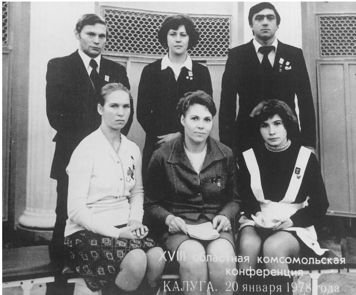
Делегаты XVIII областной комсомольской конференции от Перемышльской районной комсомольской организации.

Так, на 16-18 областных комсомольских конференциях членами и кандидатами в члены обкома ВЛКСМ избирались от перемыш-