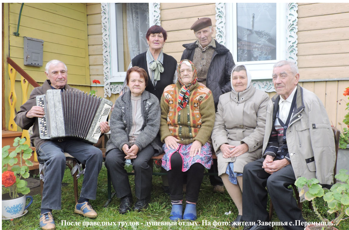
После праведных трудов - душевный отдых. На фото: жители Завершья с. Перемышль.