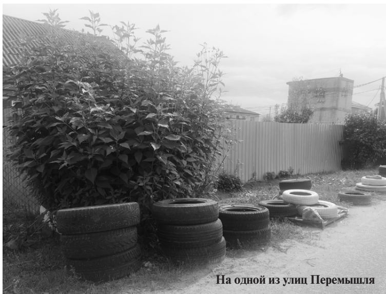
На одной из улиц Перемышля

Между тем за нарушение этого закона полагается административное наказание: физические лица, являющиеся собственниками земельных участков, за первичное нарушение заплатят до 2 тысяч рублей, за повторное — 3 тысячи рублей. Юридическим лицам грозит денежное наказание от 100 до 250 тысяч рублей. Оштрафовать могут управляющую компанию, которая плохо следит за двором, или жителя, который устроил под окнами парк резиновой скульптуры, и даже владельца загородного участка. Поэтому если у вас во дворе или на участке